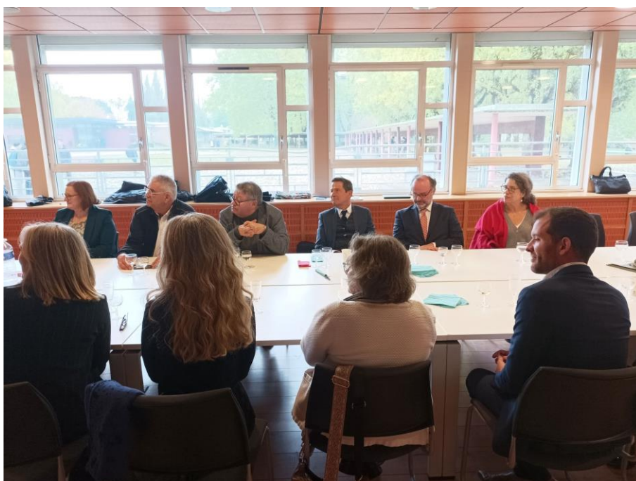
Le conseil d'administration de l'APLCPGE du 14 octobre 2024 au lycée Faidherbe (Lille)

« Certains attendent que le temps change, d'autres le saisissent avec force et agissent »